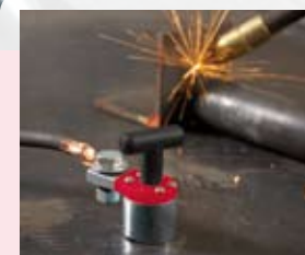
Mag-GC 200 proudová zatížitelnost 200