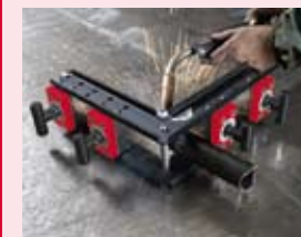
Schopný se přidržet na rovném povrchu i na potrubí