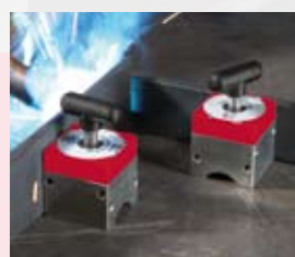
Mag-SQ 68 68 kg oddělovací síla

Mag-SQ 450 Obj. číslo 4932352568 Kód EAN 4002395372263