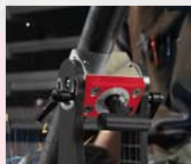
Přidržení na plochých vrstvách a na potrubí

Mag-Boomerang 272 Obj. číslo 4932352572 Kód EAN 4002395372300