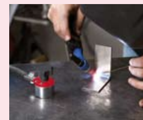
Mag-GC 300 proudová zatížitelnost 300