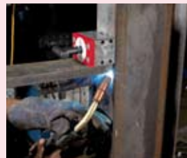
Mag-SQ 450 450 kg oddělovací síla