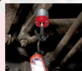
Mag-H 11 v provozu

Mag-H 18 Obj. číslo 4932352577 Kód EAN 4002395372355