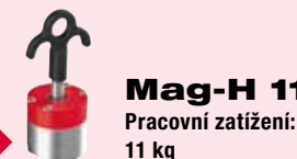
Mag-H 11 Pracovní zatížení: 11 kg