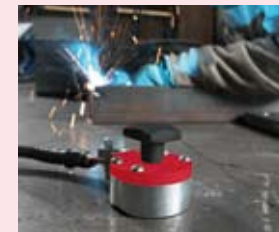
Mag-GC 600 proudová zatížitelnost 600