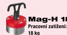
Mag-H 18 Pracovní zatížení: 18 kg