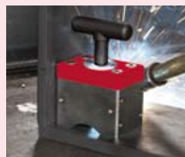
Mag-SQ 272 272 kg oddělovací síla