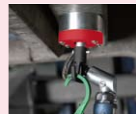
Mag-H 18 v provozu