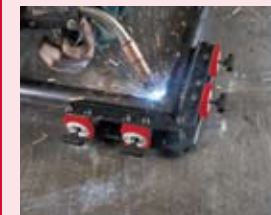
Vnitřní / vnější úhly