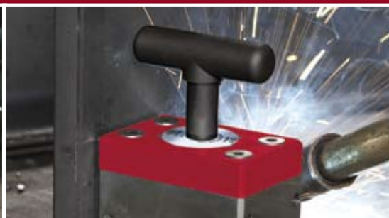
Lehké zapnutí/vypnutí. Madlo na zařívovanie.