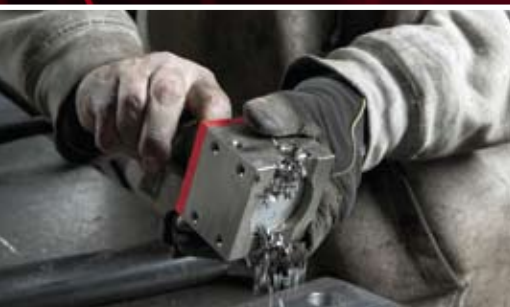
Čistší práce. Vypněte Magswitch a šrot padne na zem.