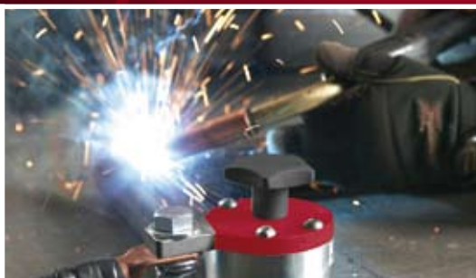
Pevné přitisknutí k plochému a potrubnímu povrchu.