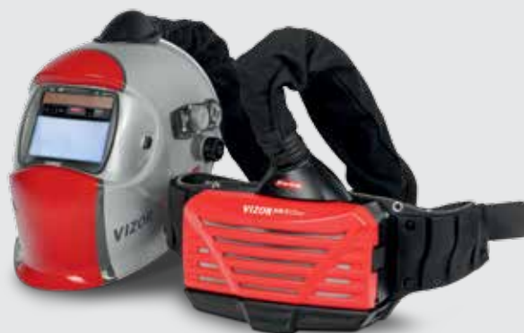
/ Vizor 4000 Air/3 Professional – ochrana dechu s kuklou a filtrační jednotkou

/ Perfect Welding / Solar Energy / Perfect Charging